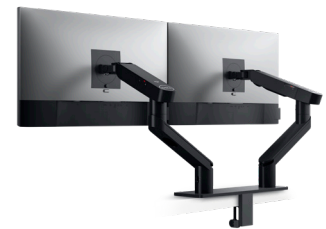
DELL MONITORARM FÜR ZWEI BILDSCHIRME | MDA20

Schließen Sie Ihr Dell Dock einfach an den Montagesatz für das Dell Dock an und montieren Sie es hinter einem Monitor, an einer Wand oder unter dem Schreibtisch, um einen Arbeitsplatz ohne Kabelgewirr zu schaffen.