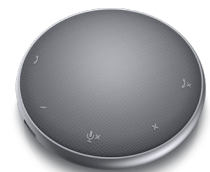
DELL MOBILE ADAPTER MIT FREISPRECHFUNKTION | MH3021P

Genießen Sie faszinierende Details und lebensechte Farben auf diesem brillanten 27"-4K-Monitor mit umfassender Farbabdeckung.