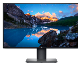
DELL ULTRASHARP 27 4K USB-C-MONITOR | U2720Q

Dieses kompakte Set aus Tastatur und Maus ist für einen reibungslosen Betrieb mit 3 Geräten ausgelegt, sorgt für einen übersichtlichen Schreibtisch und lässt Sie mit einer Akkulaufzeit von bis zu 36 Monaten 25 produktiv bleiben.