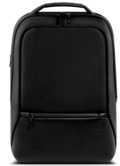
DELL PREMIER SLIM- RUCKSACK 15 | PE1520PS

Der kompakte und tragbare 7-in-1-USB-C-Mobiladapter bietet hervorragende Video- und Datenkonnektivität sowie Pass-Through (bis zu 90 W) für Ihren PC.