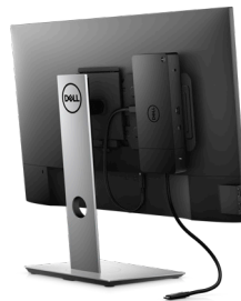
MONTAGESATZ FÜR DELL DOCKINGSTATION | MK15

Nutzen Sie die leistungsstarke Dell Thunderbolt-Dockingstation für ungebremstes Arbeiten. Laden Sie Ihr System schneller auf, unterstützen Sie bis zu zwei 4K-Displays und schließen Sie das System über ein einziges Kabel an Ihre Peripheriegeräte an.